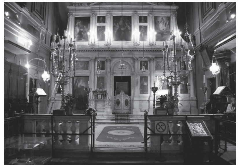
ВНУТРЕННЕЕ УБРАНСТВО ХРАМА СВТ. СПИРИДОНА ТРИМИФУНТСКОГО НА О. КОРФУ

Святитель Спиридон имел великое дерзновение пред Богом.